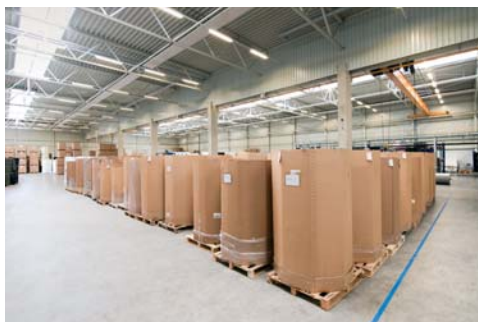
Die Zeiten der Papp-Oktabins sind Vergangenheit

Ebenso kann der OctaPack 2000 mittels RAL-Farbskala ganz nach Corporate Design-Richtlinien oder auch anderem Kundenwunsch gestaltet werden. Das Preis-Leistungsverhältnis von TRIPLEX-OctaPack 2000 & Co ist es wert, dass man es genau unter die Lupe nimmt und dabei die Umwelt- und Ressourcenschonung, wie auch den Recycle-Bonus mit dem besonderen TRIPLEX Next-Loop!-Service nicht vergisst.