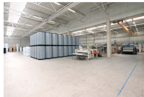
Der OctaPack lässt sich beinahe „unbegrenzt“ stapeln